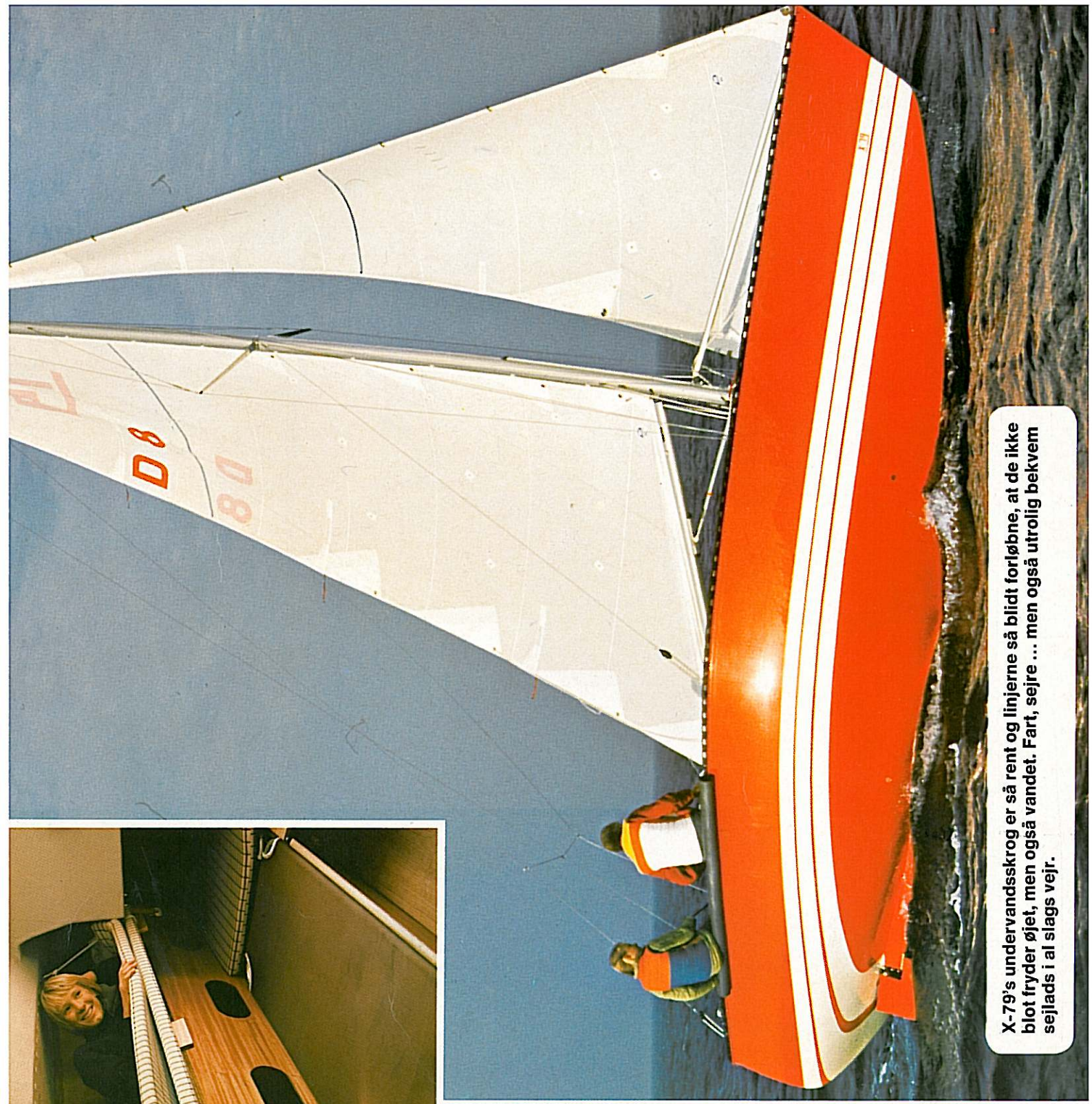
X-79's undervandskrog er så rent og linjerne så blidt forløbne, at de ikke blot tryder øjet, men også vandet. Fart, sejre ... men også utrolig bekvem sejlad i al slags vejr.